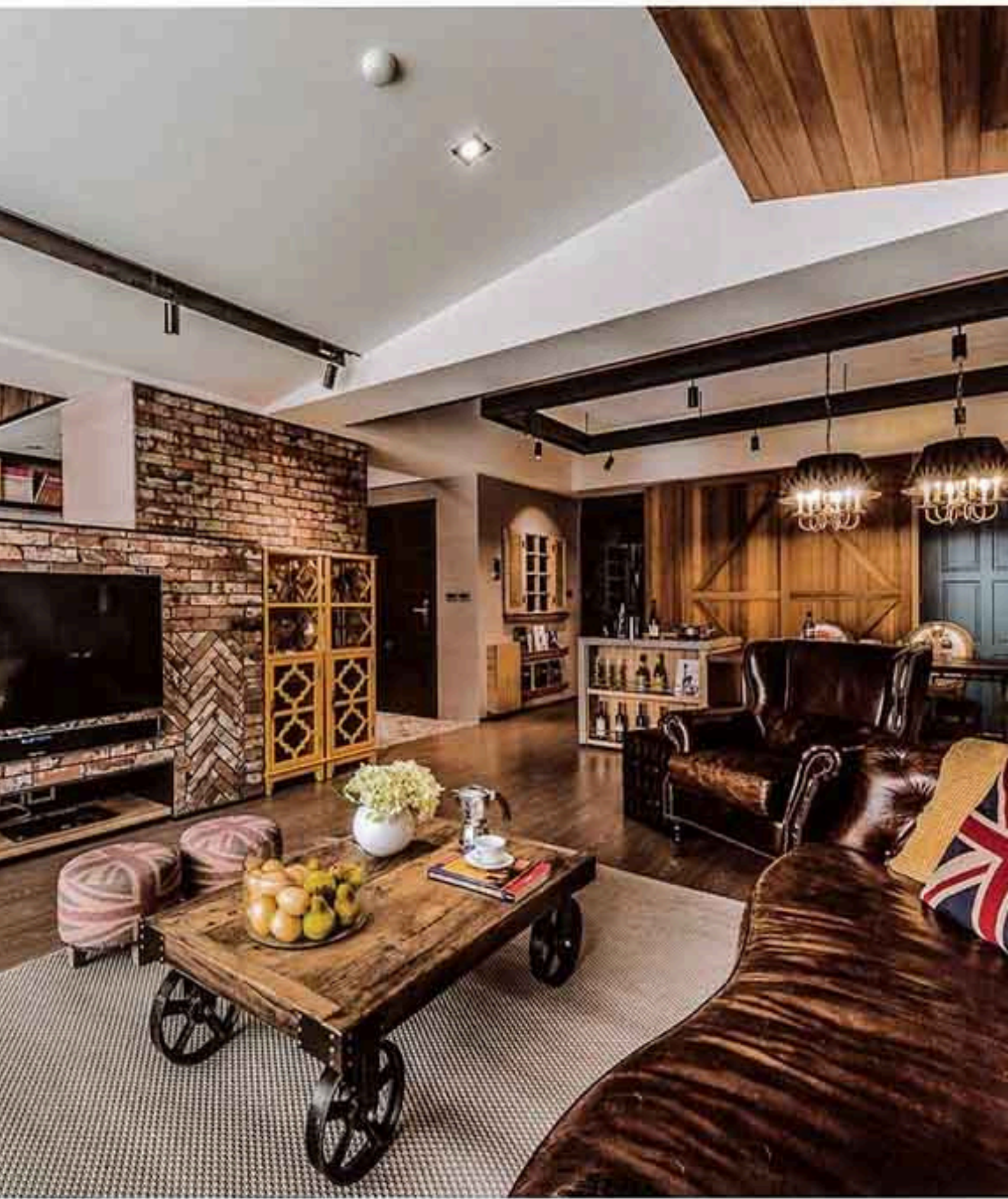
上：50坪的居家空間，依託設計用細膩的材質與有質感的家具，點綴出屋主所想要的石堡工業氛圍。