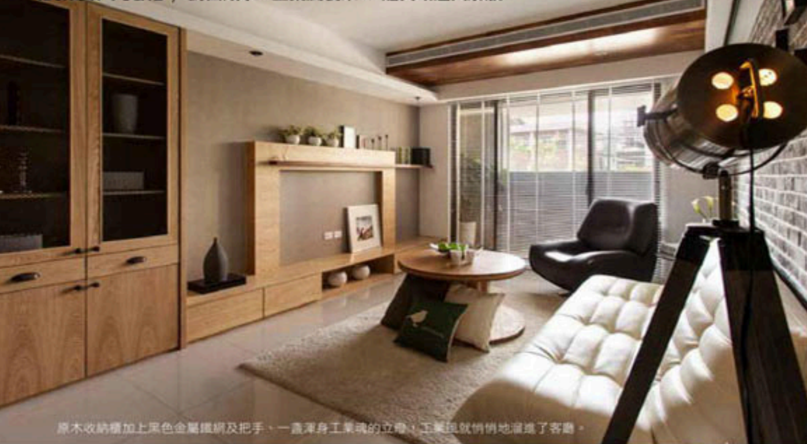
原木收納櫃加上黑色金屬鐵網及把手，一盞渾身工業魂的立燈，工業風就悄悄地溜進了客廳。