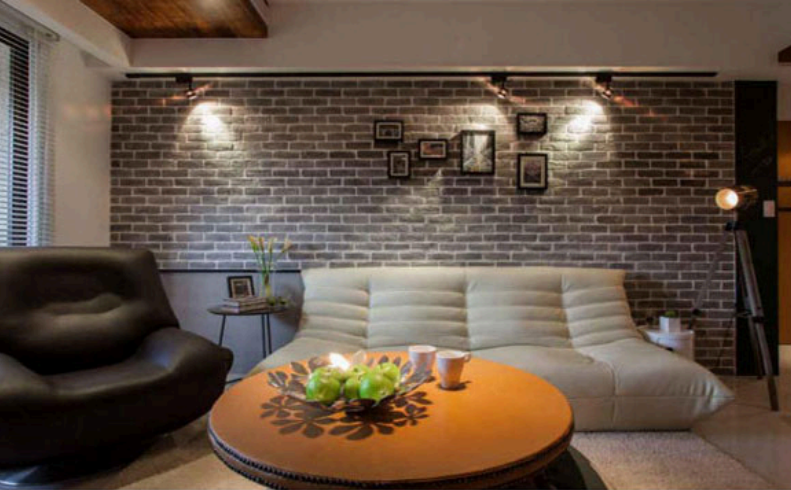
▲客廳桌面的周圍還以皮革及銅釘做裝飾點綴，成了男主人最愛的家具單品。

以便徹底將工作的煩悶壓力拋諸腦後，因此熱愛具有療癒效果的北歐風，並且還特別強調，不要讓住家景觀與街頭上的咖啡店太過相似，那樣的空間讓她無法真正放鬆。經過充分溝通並了解業主需求後，設計師重新思考了家的真正意義：「家」之所以為「家」，是它提供了溫暖休憩放鬆的功能，讓人回到家時，可以放下一天的疲憊，得到充分的休息與進行家人間的情感交流。於是，設計師特別為業主打造了適合居家生活的工業風，稱之為「點綴式工業風」。